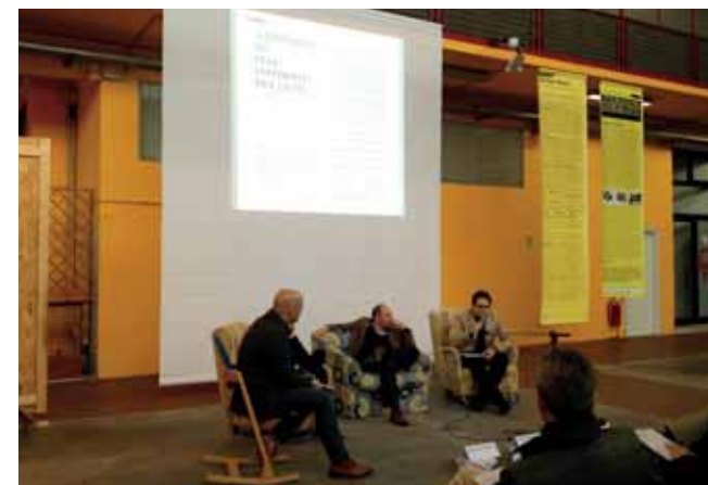
Presentazione del volume "Di Spazi. Città genere specie" presso il mercato coperto di Ferrara