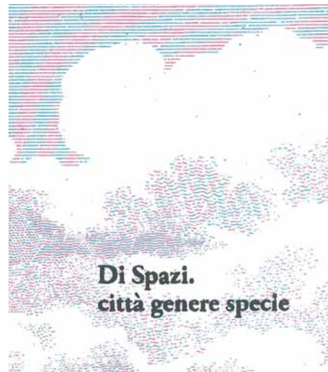
Copertina realizzata dall'illustratore Giacomo Nanni per il libro "Di Spazi. Città genere specie"