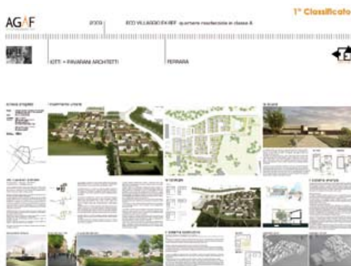
Progetto vincitore del concorso "Architetture per Ferrara / da Ferrara" Studio IOTTI + PAVARANI architetti