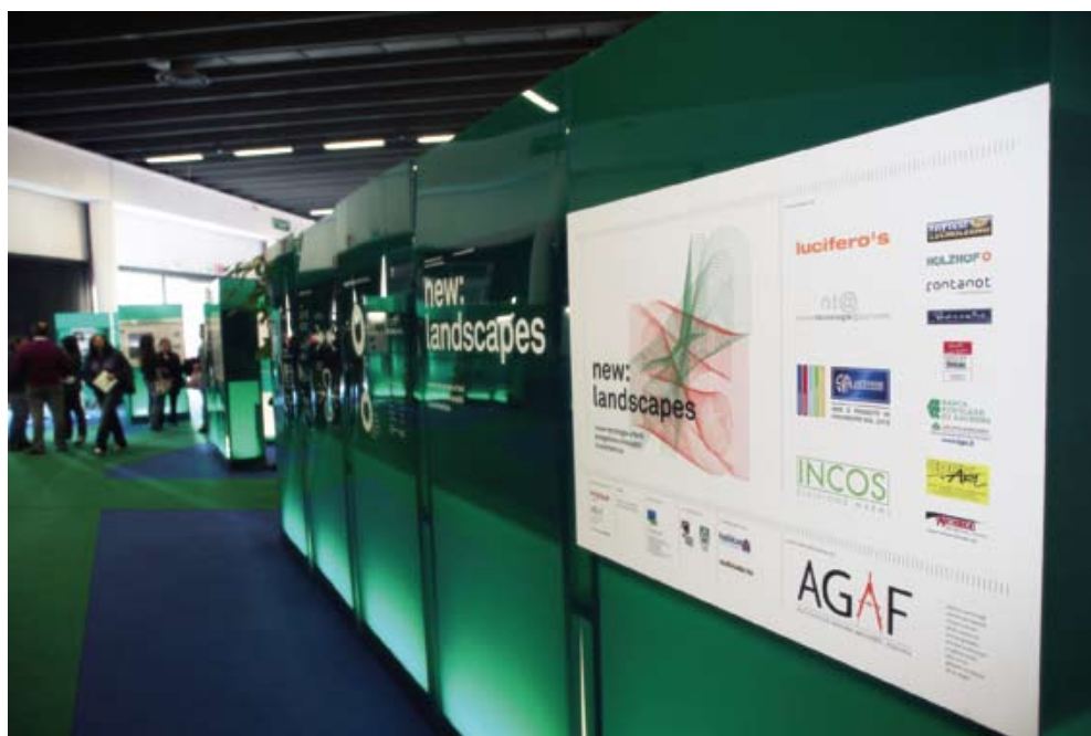
L'allestimento della mostra "New Landscapes"